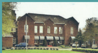
Kloosterhotel La Sonnerie

Gevestigd in het voormalig klooster van de Zusters der Liefde. Van 1874 tot 1991 heeft deze orde het klooster in het centrum van Son en Breugel bewoond. De laatste nonnen zijn in 1993 vertrokken naar het moederhuis in het naburige Schijndel.